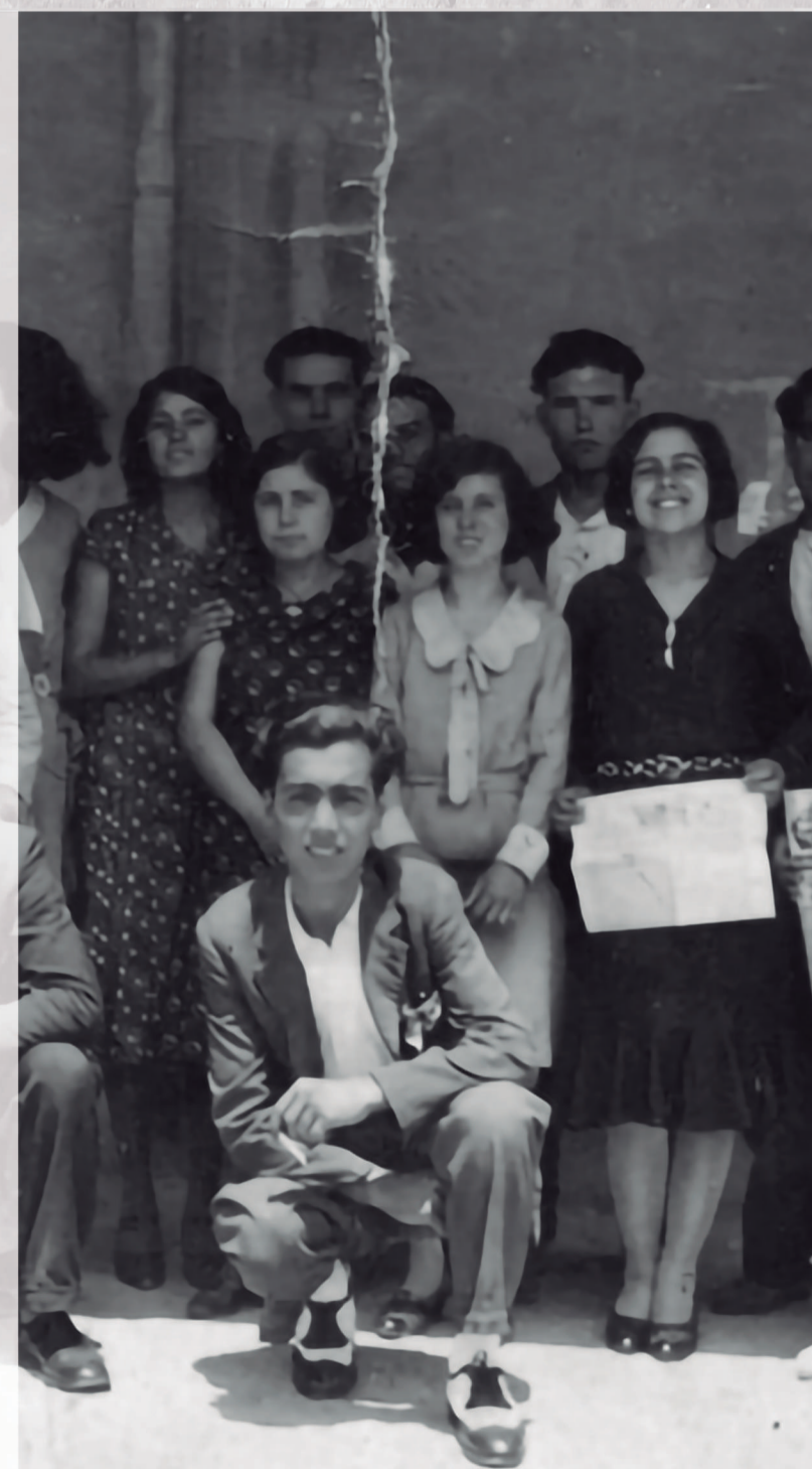
Les Roges del Molinar

Dins l'àmbit de la política i l'activisme, destacà també Francisca Bosch Bauzá, que va ocupar el càrrec de secretària general del PCE a les Illes Balears, un fet bastant inaudit a l'Espanya d'aquella època.