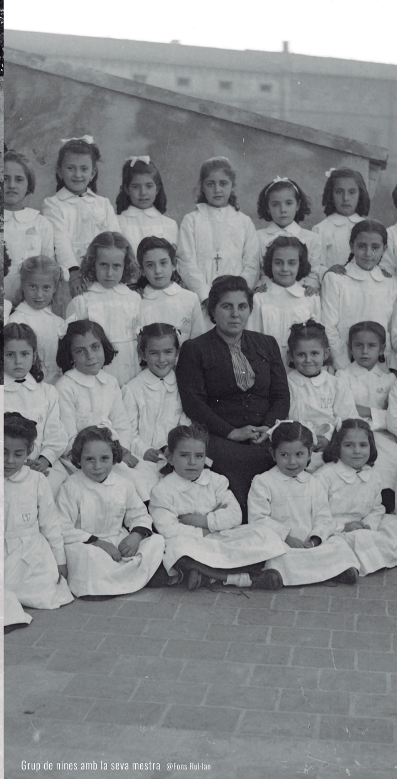
Grup de nines amb la seva mestra