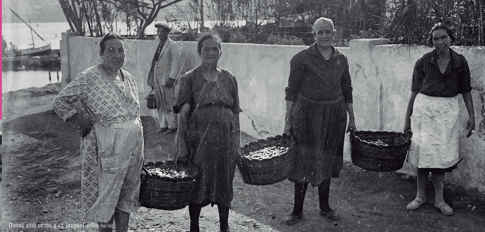
Dones amb covros a Es Jonquet @Fans Rul-Ian