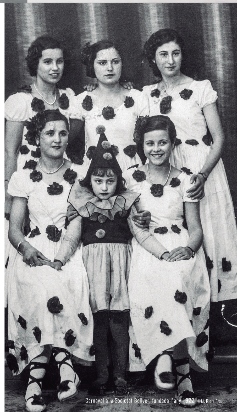
Carnaval a la Societat Bellver, fundada l'any 1922

Amb la II República arribà un enfocament pedagògic més modern de l'educació. Tanmateix, tots els avenços en l'àmbit educatiu quedarien estancats amb l'inici de la Guerra Civil.